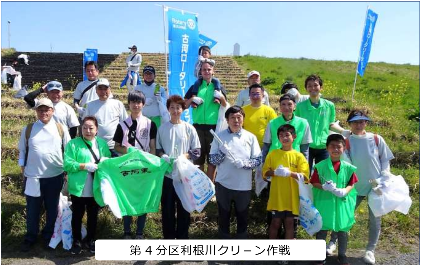
第 4 分区利根川クリーン作戦